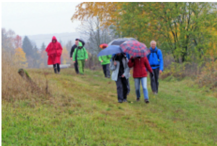
Unterwegs kam oft der Regenschirm zum Einsatz

Auf dem oberen Teil des Sachsenrings, der sich in ganzer Länge ca. 17 km um Bad Driburg legt, erreichte uns dann so langsam die Dämmerung und um ca. 17:00 Uhr erreichten die Unentwegten der langen Wanderung das Ziel, wo sie von den Aktiven der kurzen Strecke mit Beifall begrüßt wurden. Es gab wieder als Einstimmung Glühwein. Ca. 18:30 Uhr konnte sich dann jeder mit seinem vorbestellten Gericht stärken. Unsere Gäste von der Partner-Sektion Münster, die mit fünf Wanderern angereist waren, wurden mit ei-