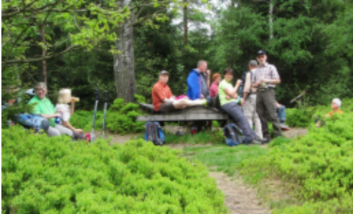
Pause kurz vor den Externsteinen