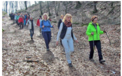
Auf Karfreitag im Teuto unterwegs

Alme 320 müNN und Nehden 400 müNN haben wir wandernd verbunden. Am Almequellbecken ging es los. Die Wege sind noch jahreszeitentsprechend vereist. In Nehden sehen wir die Dinosaurierfundstelle, kreuzen den Dorfkern und werden über den Nehdener Marmor informiert. Am eiskalten, klaren Almehühlgraben geht es zurück und wir klettern rund ums Almer Schloß über den Sturmschaden durch „Frederieke“. Kaffee und Kuchen in der Almer Schloßmühle sind sehr gut