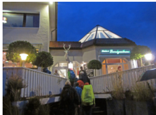
Am Ziel: "Böhler's Landgasthaus" in Bad Driburg