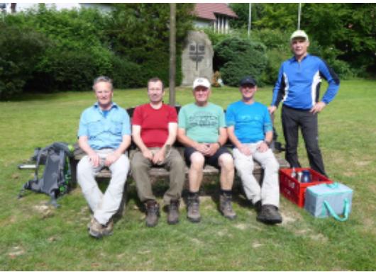
Eggeweg: Da waren es noch fünf Wanderer