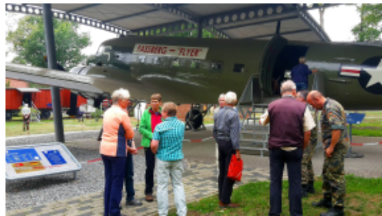
Besuch des Luftbrückenmuseums in Faßbeck

Am nächsten Tag erfolgte nach einem guten Frühstück der Abmarsch aller Wanderer vom Hotel über Hermannsburg und Müden nach Faßberg. Nach einer Stärkung mit Kaffee und