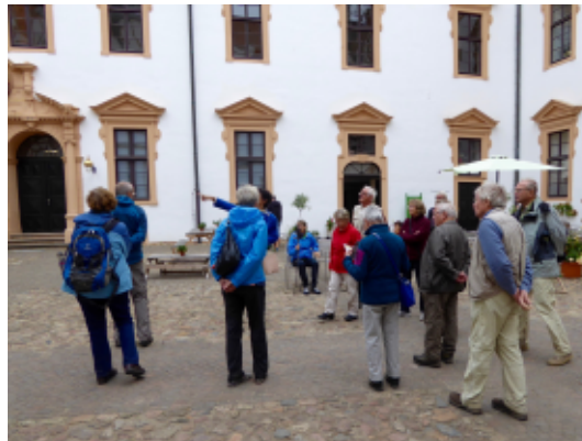
Stadtbesichtigung in Celle

Der Heidschnuckenweg gilt nicht umsonst als einer der schönsten Wanderwege Deutschlands. Typische Landschaftsbilder