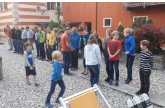
Große Füße - kleine Füße

Die Teilnehmer verteilten sich auf zwei Gästehäuser mit schönen Ferienwohnungen (Genießer), dem nahe gelegenen Campingplatz direkt am Flüsschen Sarca (Outdoorer), sowie Einzelunterkünften (Individualisten; Spätbucher).