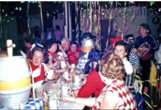
"Mitte der 70er-Jahre: Die Sektion Paderborn feiert Hüttenkarneval in der Gaststätte Bauernkamp"

Schon jetzt vielen Dank für Eure Unterstützung.