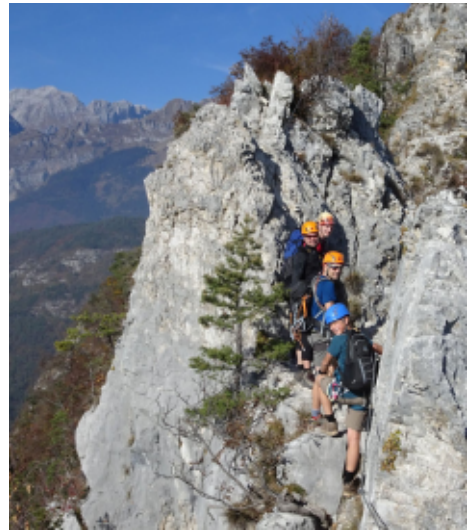
Der Gipfel in Sicht

Am ersten, dritten und vierten Abend hat sich der ganze große Haufen zu einem gemeinsamen Umtrunk mal in der Bar in der Altstadt, mal in der Pizzeria getroffen. Wenn die Unterhaltung der Erwachsenen und Jugendlichen den Kindern zu bunt wurde, konnten diese sich in der malerischen Kulisse rings um die Piazza an der Kirche austoben. Auch geruhsamere Abende beim gemeinsamen Kochen vorm Zelt oder in der