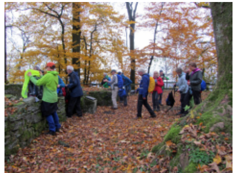
Große Pause auf der Ruine Iburg bei Bad Driburg