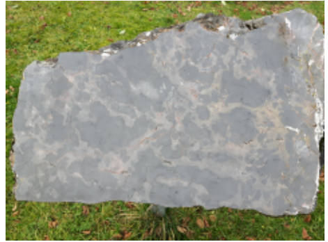
Nedener Marmor in Natura