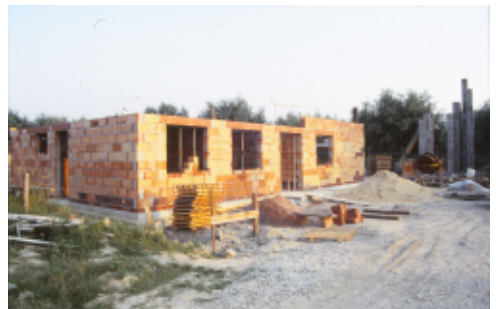
Unser Sektionshaus im Rohbau im Jahre 1993