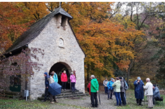
Die Wanderer der kurzen Wanderung an der Marienkapelle oberhalb von Bad Driburg