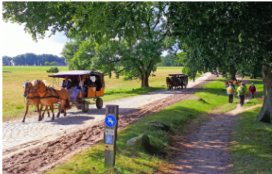
Es geht auch per Kutsche durch die Heide

Einige Mitfahrer absolvierten diese Tage auf den Sätteln ihrer mitgebrachten Fahrräder. Auch gut ausgeschilderte Fahrradwege rund um die Etappen des Heidschnuckenweges