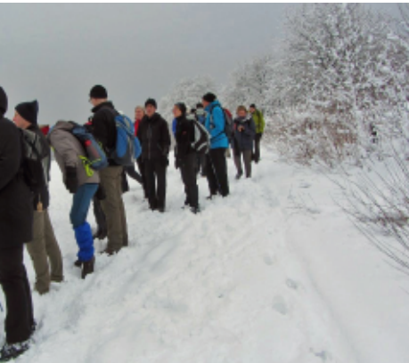
Bei herrlichem Winterwetter unterwegs

Als Einstimmung auf die Ostertage trafen wir uns beim Bienenschmidt in Lage-Höste zur Wanderung im Teuto und durch die Wistinghauser Senne.