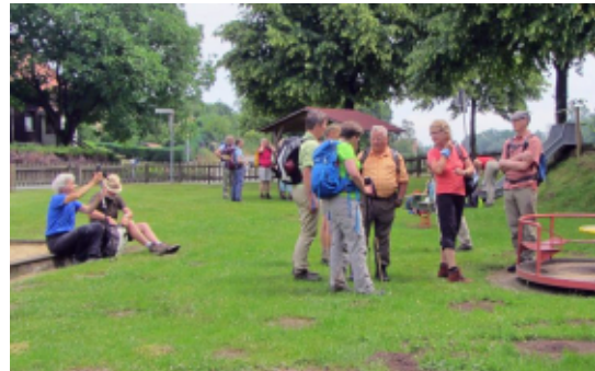
Mittagspause in Himmighausen

Ab Altenbeken ging es über Wege in der Egge, über Grevenhagen nach Himmighausen, wo die Mittagspause eingelegt wurde. Über Merlsheim, Langeland und der Emmerquelle ging es dann auf dem Emmerweg zurück nach Altenbeken.