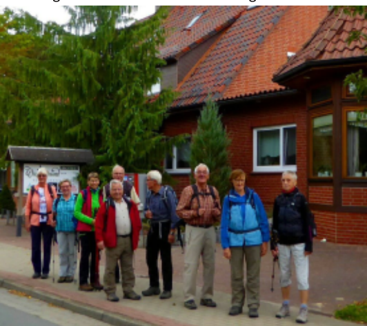
Abmarsch vom "Kiek in" Hotel

Anschließend ging die Fahrt nach Müden an der Örtze, wo wir für den Nachmittag in einer gemütlichen Kaffeestube angemeldet waren.