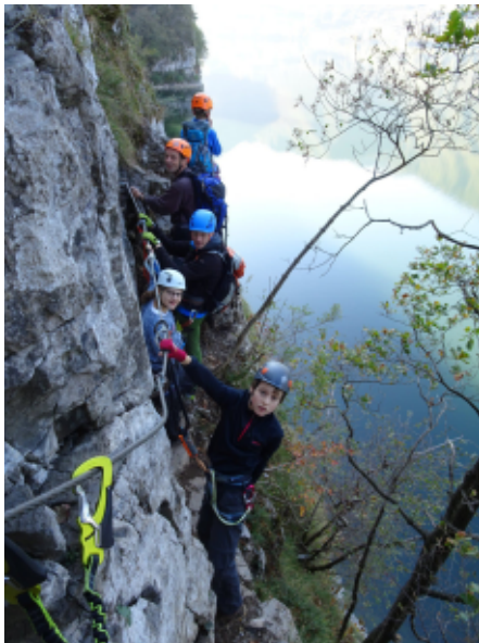
Karawane am Idrosee

Tag und der Bereitschaft aller, sich gut auf die vorhanden Fahrgelegenheiten aufzuteilen, startete jeder Tag entspannt. Je nach Aktivität trafen sich die Trupps morgens mal etwas früher oder später am großen Parkplatz vor der Altstadt, der für alle gut erreichbar war.