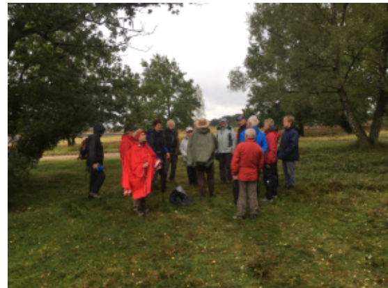
Führung mit dem Ranger durch die Heide

Einen besonderen Höhepunkt bildete am Abreisetag eine ca. 3stündige Führung mit dem „Heide Ranger“ rund um Tütsberg. Hier erfuhren die Wanderer viel Interessantes über Ent-