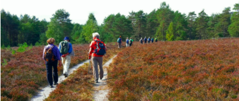
Wanderung in der Misselhorner Heide

Die Heideflächen der Misselhorner Heide bei Hermannsburg gehören zu den schönsten des Naturparks Südheide. Sanfte Hügel mit weitläufigen Heideflächen, knorrige Wacholder und geheimnisvolle Wasserflächen sind charakteristisch für diese vielfältige Landschaft.