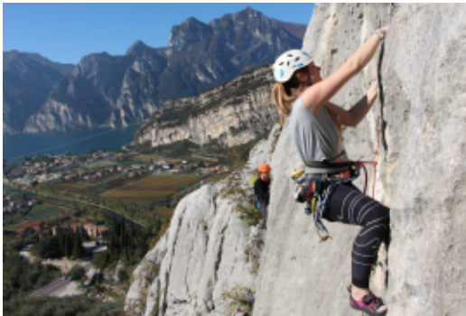
Hoch über dem Gardasee