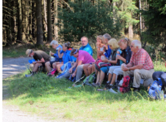
Testwanderung: Stärkung auf dem höchsten Punkt

natürlich auch offen für andere Wanderer ohne Tourgepäck. Der Rundweg war wieder im Bereich vom Briloner Höhenweg, Brilon-Wald und Rothaarsteig. Kurz vor Schluss machten wir auch wieder die Einkehr in die Hiebammenhütte am Rothaarsteig.